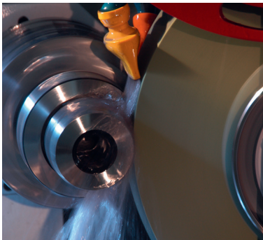
Rectificado cilíndrico (Imagen: rectificadora Studer)