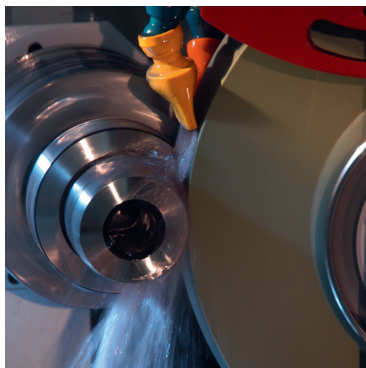
Válcové broušení (na obr. je stroj Studer)