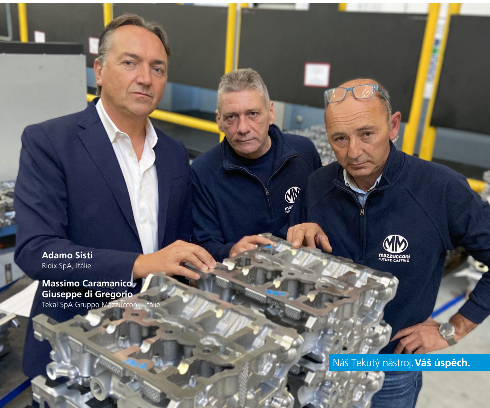
Adamo Sisti Ridix SpA, Itálie