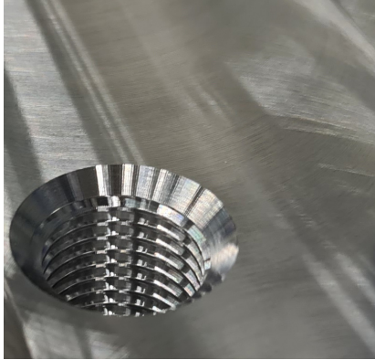
表面: 即使是敏感的鋁合金也可保證完美無瑕